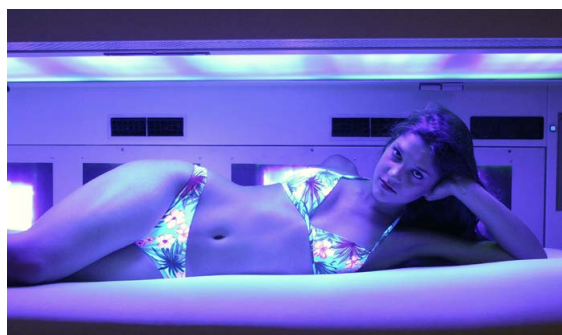
Sonne tanken kann man natürlich auch in den Grazer Sonnenstudios.