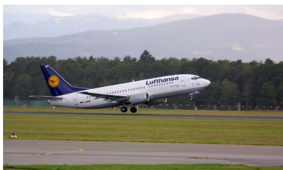
Ab in den Süden: Mit dem Flieger geht's auch der Sonne entgegen.